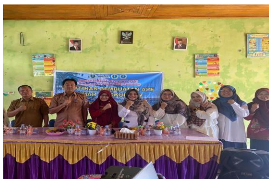
Gambar 2. Pemaparan Pelatihan APE

Kegiatan kepada Masyarakat di TK Negeri 2 Pagaram dilaksanakan dalam beberapa kegiatan: