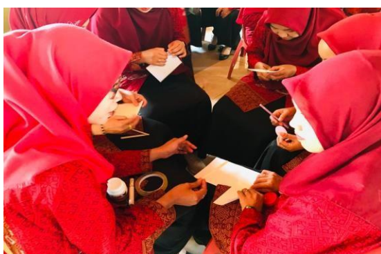
Gambar 1. Tes Awal

Kegiatan pengabdian pada masyarakat ini dilaksanakan pada tanggal 16 Oktober 2023 di TK Negeri 2 Pagaram dengan khlayak sasaran guru-guru PAUD di Kota Pagaram yang berjumlah 40 orang. Kegiatan pengabdian pada masyarakat ini berupa sosialisasi dan pelatihan Pelatihan Pembuatan Alat Permainan Edukatif (APE) Ramah Lingkungan (Bahan Bekas) Untuk Meningkatkan Kreativitas Guru. Sebelum dilakukannya penyampaian materi berkaitan dengan Alat Permainan Edukatif (APE) Ramah Lingkungan (Bahan Bekas) Untuk Meningkatkan Kreativitas Guru kegiatan pengabdian ini melakukan tes awal, dimana guru diajak membuat APE sederhana dengan menggunakan 2 bahan saja yaitu (kertas A4 dan stik eskrim).