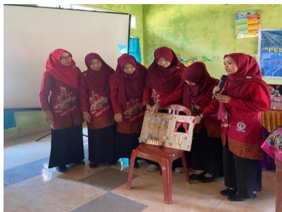
Gambar 4. Paparan tes akhir APE

Selain itu juga kreativitas seorang pendidik ditantang, dimana pendidik harus menciptakan media pembelajaran berupa APE menggunakan bahan ramah lingkungan (bahan bekas).